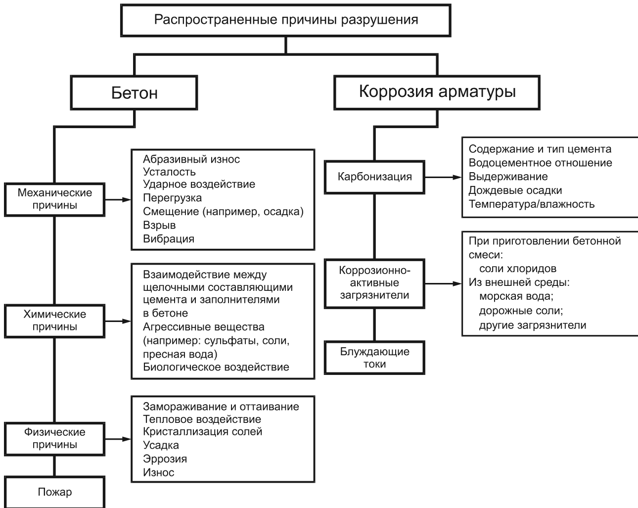
Рисунок 1 — Распространенные причины разрушений конструкций

Дальнейшей оценке подлежат примерный объем и вероятная интенсивность прироста дефектов. Следует определять, когда бетонная конструкция или ее элемент больше не будут функционировать так, как предполагалось, без принятия мер по защите или ремонту (не считая мер технического обслуживания находящихся в эксплуатации систем).